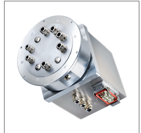
▲ Hochstrom Schleifring SR250H bis 80 A und mehr.