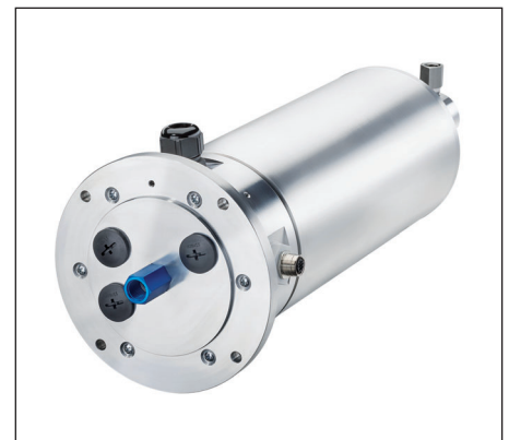
▲ Schleifring SR120: Innovative Kontakttechnologie und maximale Flexibilität.

und Nutzung von Industrial Ethernet, als Beispiel sei Getränkeabfüllung mit Filling-Capping-Labeling genannt, erfordert Schleifringe, die durch Plug and Play in ein vorhandenes Netzwerk integrierbar sind und Real-Time Ethernet unterstützen, unabhängig vom verwendeten Datenprotokoll. Basierend auf unseren bewährten Kontakttechnologien erreichen wir einen störungsfreien Betrieb und eine maximale Verfügbarkeit mit sehr langen Wartungszyklen. Je nach Anwendung sind Geräte bis zu 5 Jahre wartungsfrei bei sehr niedriger Bitfehlerrate. Soviele zur Grundausstattung von Schleifringen aus den Produktfamilien SR120,